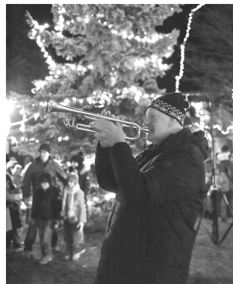
Kompletní fotogalerii najdete na FB a webu obce