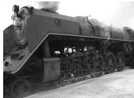
Historický vlak 6.3.2010 na stochovském nádraží