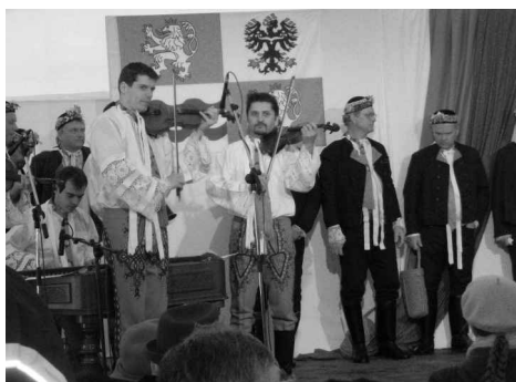
Mužácký soubor z Mutěnic