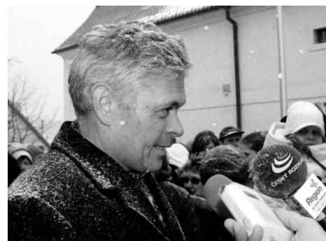
Autor sochy T.G.M. Petr Novák