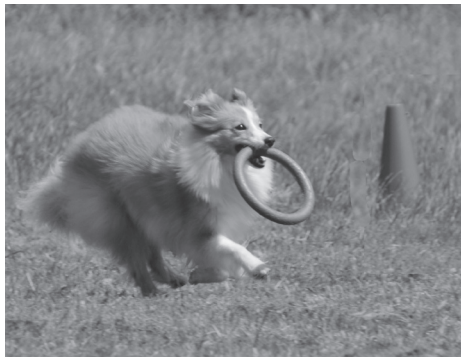
Ukázka psího sportu Dog Puller

Máte malého či mladého pejska? Naše organizace nabízí socializační hodiny pro štěňata. Páníčci se učí vést svého pejska a pejsek se učí chovat na ulici i mezi ostatními psy. Na socializačních hodinách si osvojíte, jak zvládnout základní povely nebo jak naučit či odnaučit svého pejska různým „zvykům“. Pejsek se učí zvládat ostatní psy, osvojí si nové dovednosti