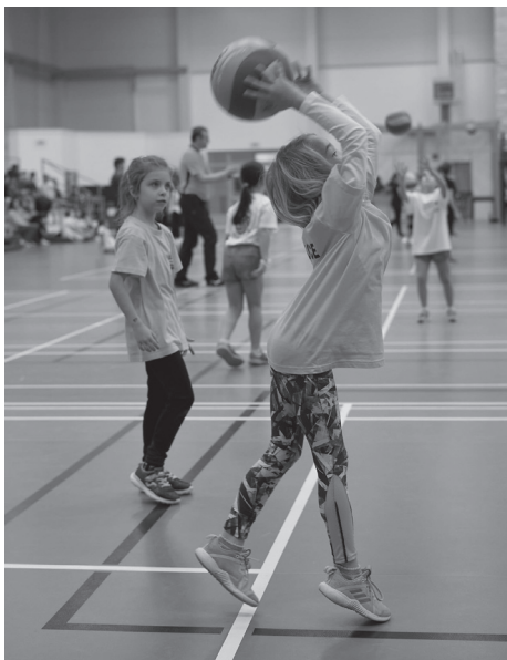
Nadějně hráčky tuchlovického minivolejbalu

Účastníme se turnajů žlutého a červeného minivolejbalu, které organizuje Středočeský volejbalový svaz. Abychom se dobře umístili, musíme trénovat na 100 %. Na prvním letošním turnaji ve žlutém minivolejbalu v Hořovicích se nám to již vyplatilo. Po úvodních prohrách jsme porazili Kladno Volebal CZ a Hořovice B a umístili jsme se na krásném 2. místě. V červeném minivolejbalu, který je založen na volejbalovém podání a odbití obouručí vrchem – prsty, potřebujeme doplnit stavy našich talentovaných hráček. Pro dívky, které mají zájem o účast na našich trénincích a turnajích ve žlutém a červeném minivolejbalu, je důležitá chuť trénovat a také rok narození 2015 ± 2 roky (tj. od roku 2017 do roku 2013). Rovněž uvítáme dívky, které jsou narozené v roce 2012 a jsou sportovně nadané.