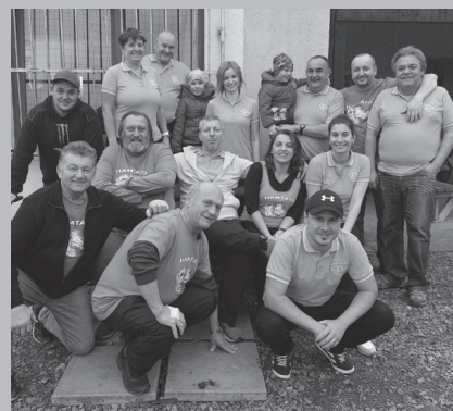
Plná sestava klubu Hamtáto