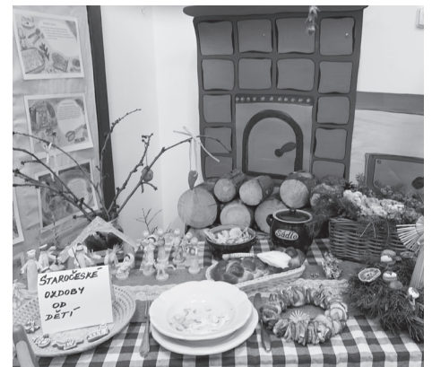
Výzdoba ve stylu staročeské chalupy zdobila vestibul MŠ