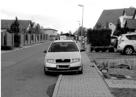
Parkování na chodníku a navíc v protisměru.

Nesprávné parkování aut trápí nejen velká města, ale i naši malou vesnici. Přeci není nutné zastavit vždy 1 m od branky svého domu, co nejbližší k budově mateřské či základní školy, přede dveřmi na poštu nebo zablokovat vjezd sousedovi, když na dohled je parkoviště. Vždyť většina z nás má dvě zdravé nohy,.... Co s tím? Protože si myslíme, že k nápravě stačí někdy málo, připravili jsme dopravní seriál na pokračování, kde se budeme věnovat dopravním přestupkům v obci. Nejsme příznivci represe, jde nám o osvětu a nápravu. Díky, že budete věnovat následujícím rádkům pozornost a řeknete sousedovi, že parkovat před vaší (nebo cizí) garáží a ještě v protisměru by opravdu neměl. I když to bude mít ke své brance o několik metrů dál.