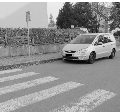
Parkování před přechodem pro chodce u školy ohrožuje přecházející děti.

2. Vozidlo má odrazky jen na zadní části, pokud stojí přední částí směrem do provozu, v noci jej bude těžké zahlédnout.