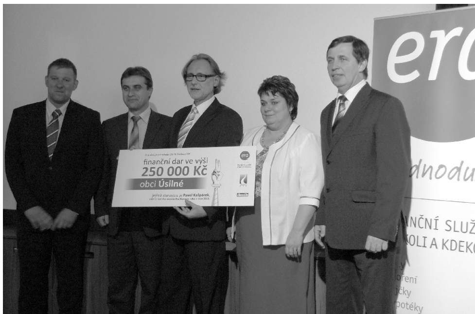
Finalisté soutěže ERA - Starosta roku 2011