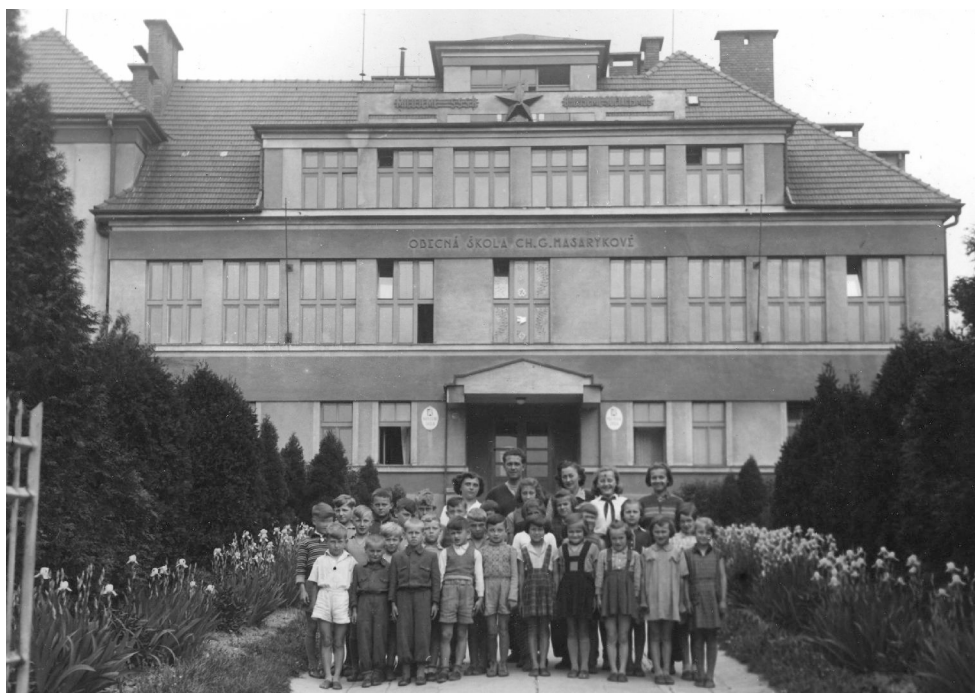
Historická fotografie školy z doby po 2. světové válce