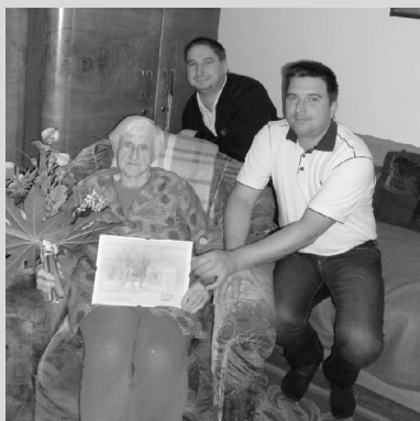
Na snímku s jubilantkou členové občanského sdružení Náš Vašírov.