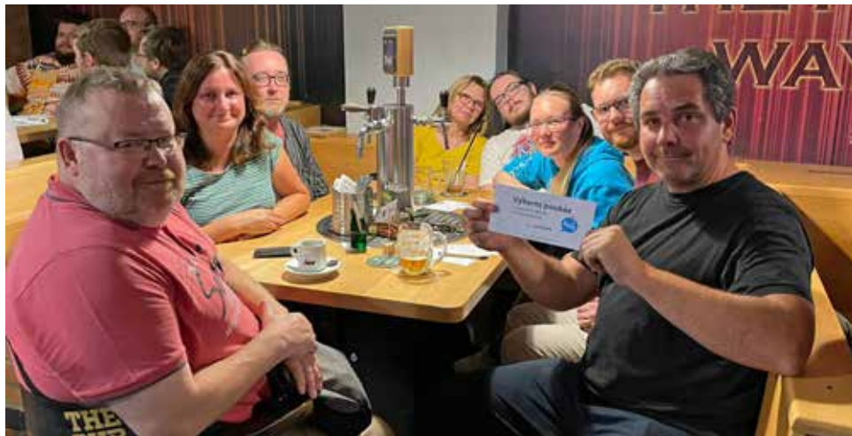
Tým Komety na středočeském finále Hospodského kvízu v Praze.

Možná už jste někdy slyšeli o Hospodském kvízu. Jedná se o vědomostní soutěž probíhající každý týden ve stovkách podniků po celé republice.