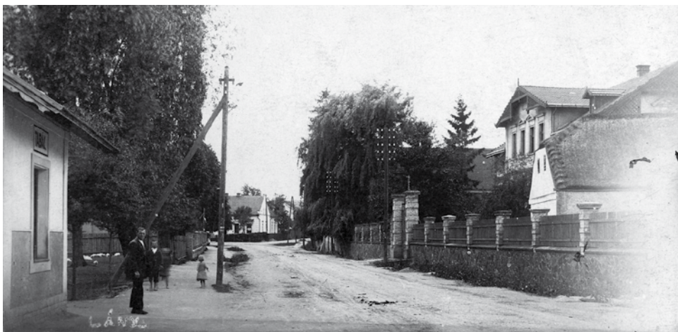
Náměstí v Lánech na historické fotografii.