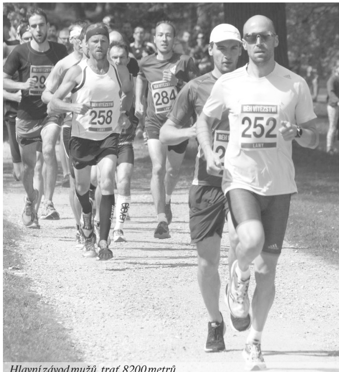
Hlavní závod mužů, trať 8200 metrů.

Nevim, kdo to počasí tam „nahore“ zamlouvá, ale při Běhu 8. května jsme zase měli štěstí. Bylo pěkně, slunce svítilo, ale foukal studený vítr. Ten si vytrpěly zejména pořadatelky při prezenci. Hlavními pořadateli závodu je TJ Sokol Lány a ZŠ Lány, svoji podporu nachází i u Obce. Kvůli opravám kolem rybníka museli pořadatelé změnit trasy i místa startu a cíle. Ale vybrali dobře, závodníci si novou, o trochu delší trať pochvalovali. Ve dvaceti čtyřech běžeckých kategoriích závodu celkem 544 běžců, z toho bylo 337 dětí, 83 žen a 124 mužů. 65 z nich hlásilo bydliště Lány, ale přihlašovali jsme běžce nejen z blízkého okolí, ale i z Hradce Králové, Mostu, Teplic, Kolína, Adamova, Ústí nad Labem, Mladé Boleslavi, Hořovic, Popradu, Rožnova pod Radhoštěm, a dokonce i ze španělské Zamary. Zajímavé je, že s každým ročníkem přibývá v závodě žen. Nejstarším závodníkem byl pan Jan Svoboda narozený v r. 1943. Z lánských