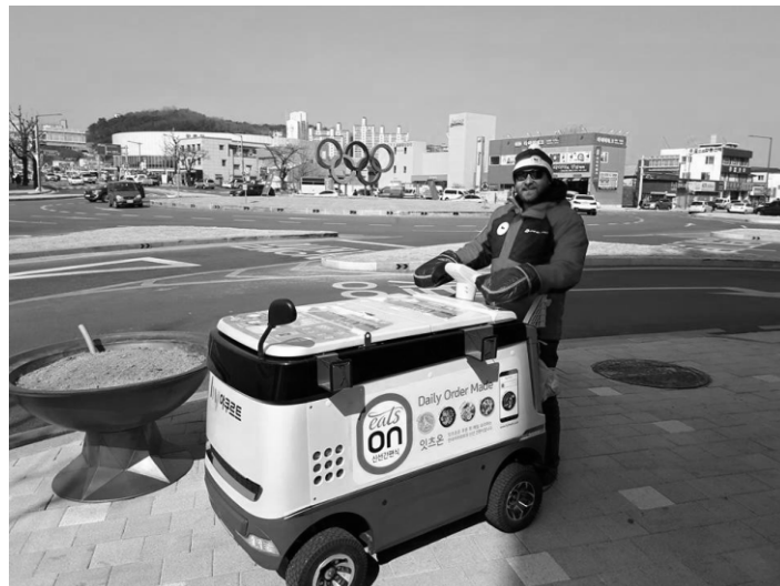
Neúspěšný pokus o odcizení zmrzlinař. vozu v ulicích Kangnungu, byl při přimrzlý.