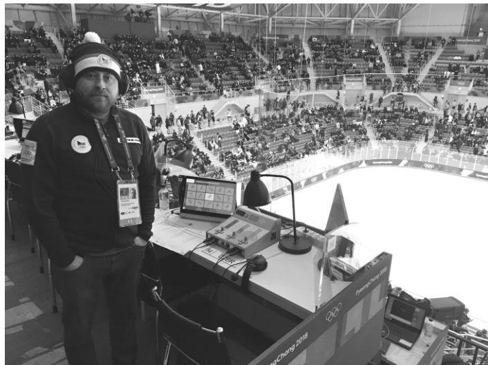
Komentátorská pozice Radiožurnálu v hale v Kangnungu.